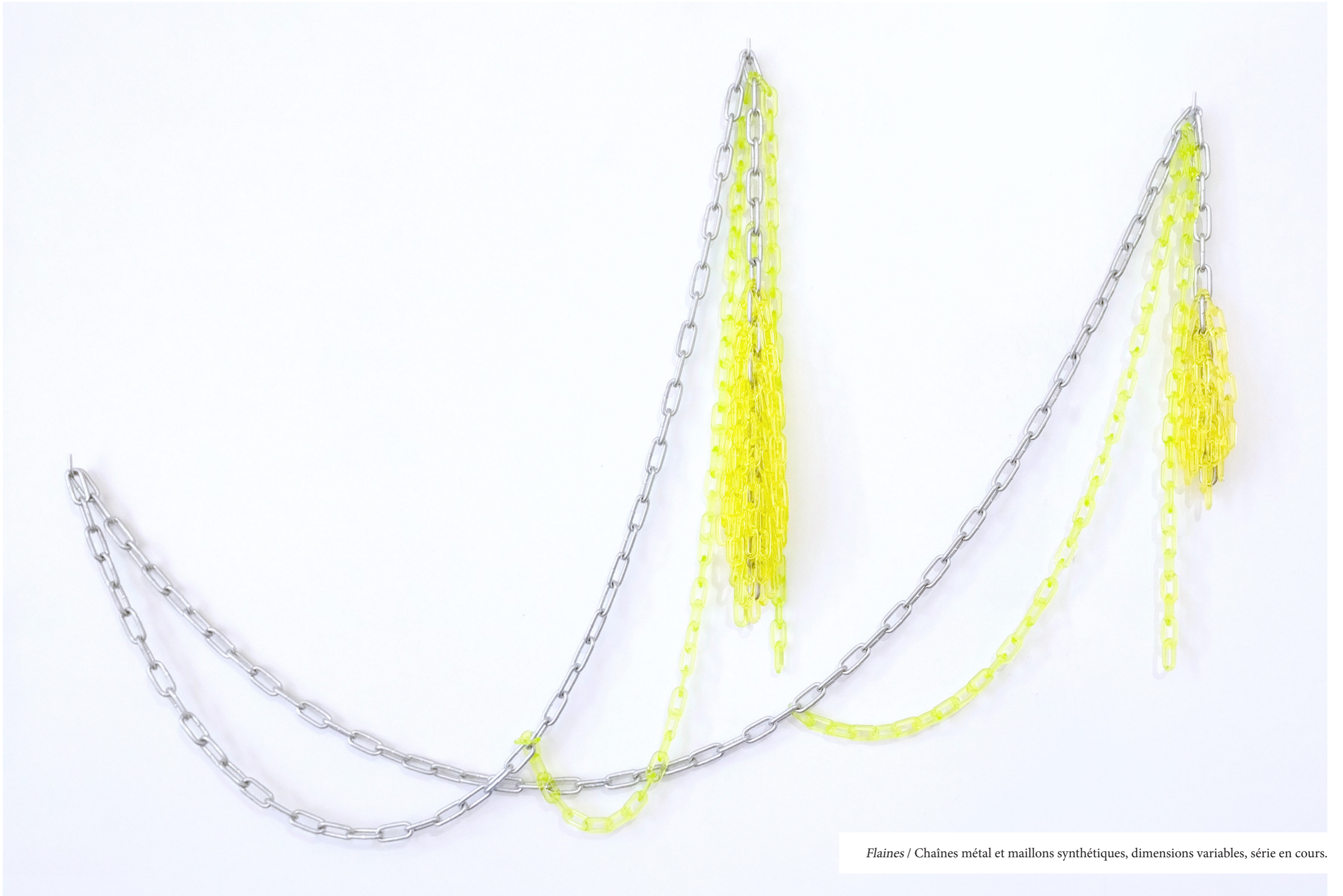
Flaines / Chaînes métal et maillons synthétiques, dimensions variables, série en cours.