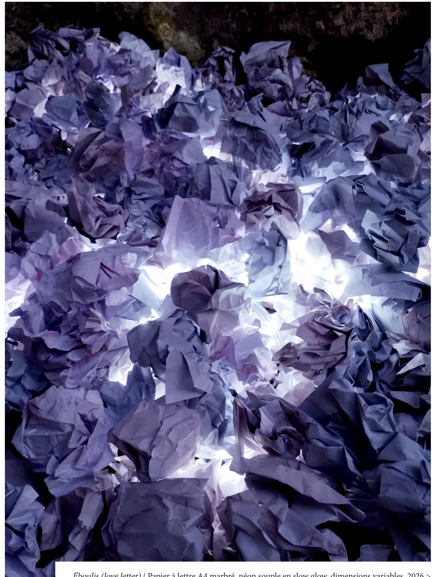
Éboulis (love letter) / Papier à lettre A4 marbré, néon souple en slow glow, dimensions variables, 2026 >

«What You Sea Is What You Get» - solo @ Continuum, Bordeaux.