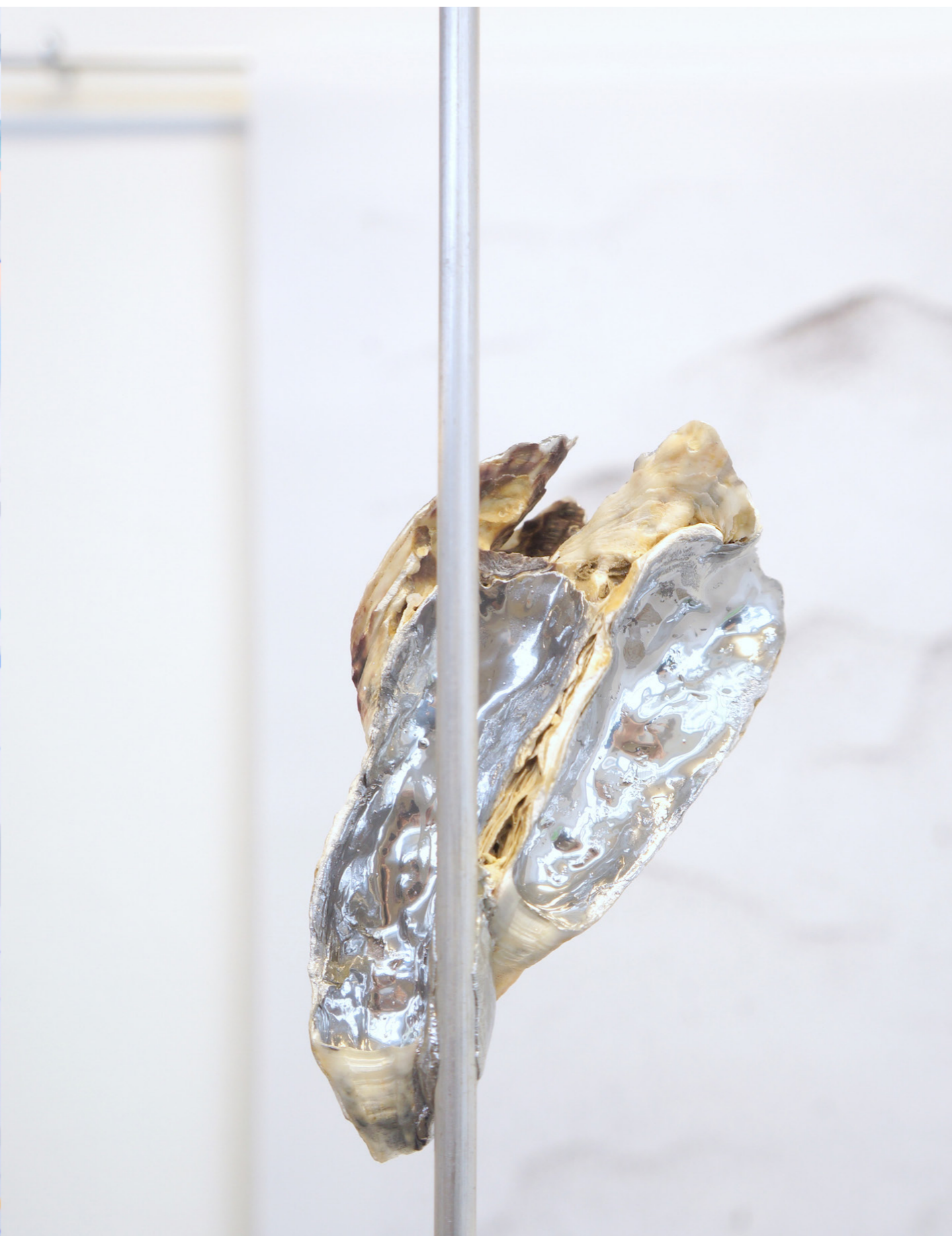
Sea Flowers / Huîtres, peinture extra chrome, tiges alu, socles-solifieurs, 200x15x20 cm , 6 pièces, 2022. What You Sea Is What You Get / solo @ Continuum, Bordeaux, 2022.